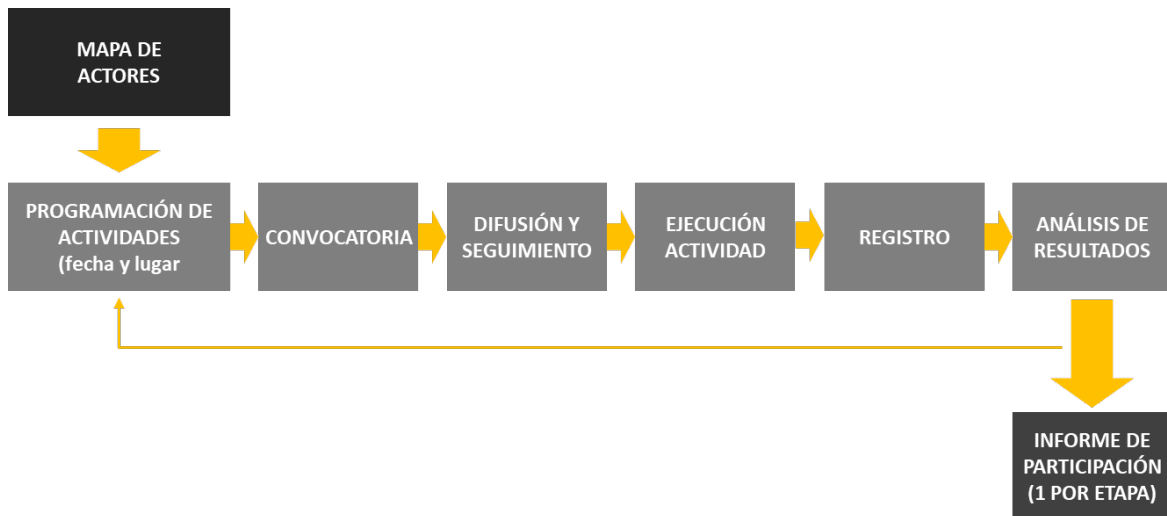
Figura 3: Proceso Instancias de Participación Ciudadana

Las actividades se desarrollarán según el siguiente proceso: